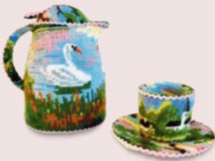
Ulla-Stina Wikander, Coffee break (2018, borduurwerk over keramiek). 1.180 euro bij Cokkie Snoel.