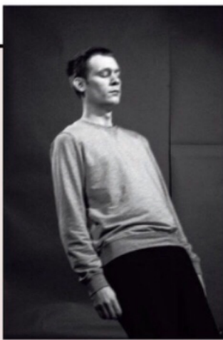
Tom Callemin, Twelve times falling (2019, inkjetprint in oplage van 12 unieke exemplaren). 600 euro bij We Like Art.