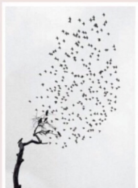
Pentti Sammallahti, Delhi, India (1999, ingelijste foto in angelimiteerde oplage). 1.150 euro bij Wouter van Leeuwen