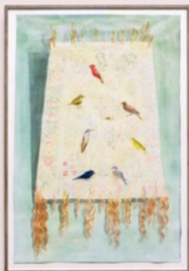
Femmy Otten, Only birds should tweet (2018, verf op doek) 5.500 euro bij Galerie Fons Welters.